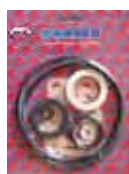
ДВИГАТЕЛЬ OMEGA Rif. 40345