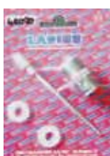
КОМПЛЕКТ ШТОК И МУФТА AT300 Rif. 40020