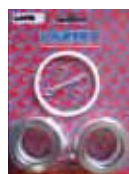
NOVA 68:1 - OMEGA 34:1 Rif. 40300