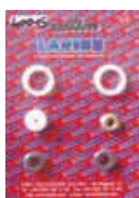
КОМПЛЕКТ УПЛОТНИТЕЛЕЙ AT300 Rif. 40015