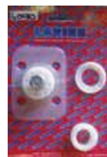
КОМПЛЕКТ МЕМБРАНЫ MIRÓ-LARIETTE Rif. 40130