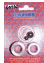
КОМПЛЕКТ ЗАБОРНОЙ СИСТЕМЫ ZEFIRO Rif. 40116