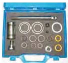
Комплект для ремонта заборной системы DRAGON Rif. 40108