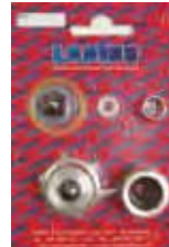
КОМПЛЕКТ СПУСКОВОГО КЛАПАНА DALÍ Rif. 33033