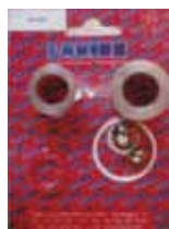
КОМПЛЕКТ ЗАБОРНОЙ СИСТЕМЫ EXCALIBUR Rif. 40106