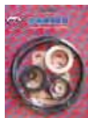
ДВИГАТЕЛЬ OMEGA Rif. 40345