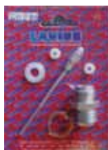
КОМПЛЕКТ УПЛОТНИТЕЛЕЙ L91X Rif. 40280