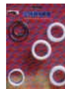
УПЛОТНИТЕЛИ TEFLON V5:1 - G10:1 разведенная структура Rif. 40236