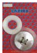
КОМПЛЕКТ МЕМБРАНЫ GIOTTO Rif. 40175