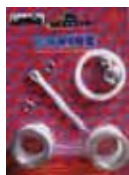
ЗАБОРНАЯ СИСТЕМА СЕРИЯ Ghibli 40:1 Rif. 40060