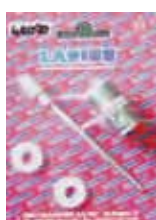
КОМПЛЕКТ ШТОК И МУФТА AT300 Rif. 40020