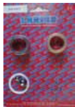
КОМПЛЕКТ ЗАБОРНОЙ СИСТЕМЫ TAURUS Rif. 40347