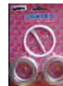
УПЛОТНИТЕЛИ ТЕФЛОНОВЫЕ NOVA 45:1 OMEGA 23:1 Rif. 40070