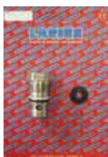
КОМПЛЕКТ СПУСКОВОГО КЛАПАНА MIRÓ Rif. 40131