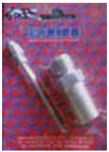
КОМПЛЕКТ PLA Rif. 40220