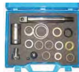
Комплект для ремонта заборной системы THOR Rif. 40109