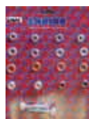
ВИНТЫ ПЕРЕКЛАДИНЫ VEGA - GHIBLI Rif. 40401