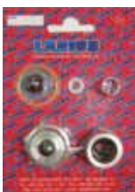
КОМПЛЕКТ КЛАПАНА GIOTTO Rif. 83033