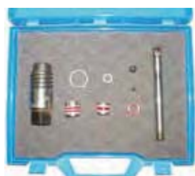
Комплект для ремонта заборной системы New EXCALIBUR New EXCALIBURr Top Finish Rif. 40107