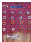
ВИНТЫ ПЕРЕКЛАДИНЫ VEGA - GHIBLI Rif. 40401