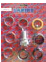
КОМПЛЕКТ УПЛОТНИТЕЛЕЙ THOR Rif. 20173