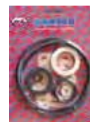
ДВИГАТЕЛЬ NOVA Rif. 40065