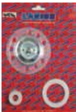
КОМПЛЕКТ МЕМБРАНЫ DALÍ Rif. 40234