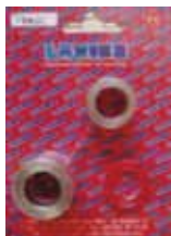
КОМПЛЕКТ УПЛОТНИТЕЛЕЙ EXCALIBUR Rif. 18855